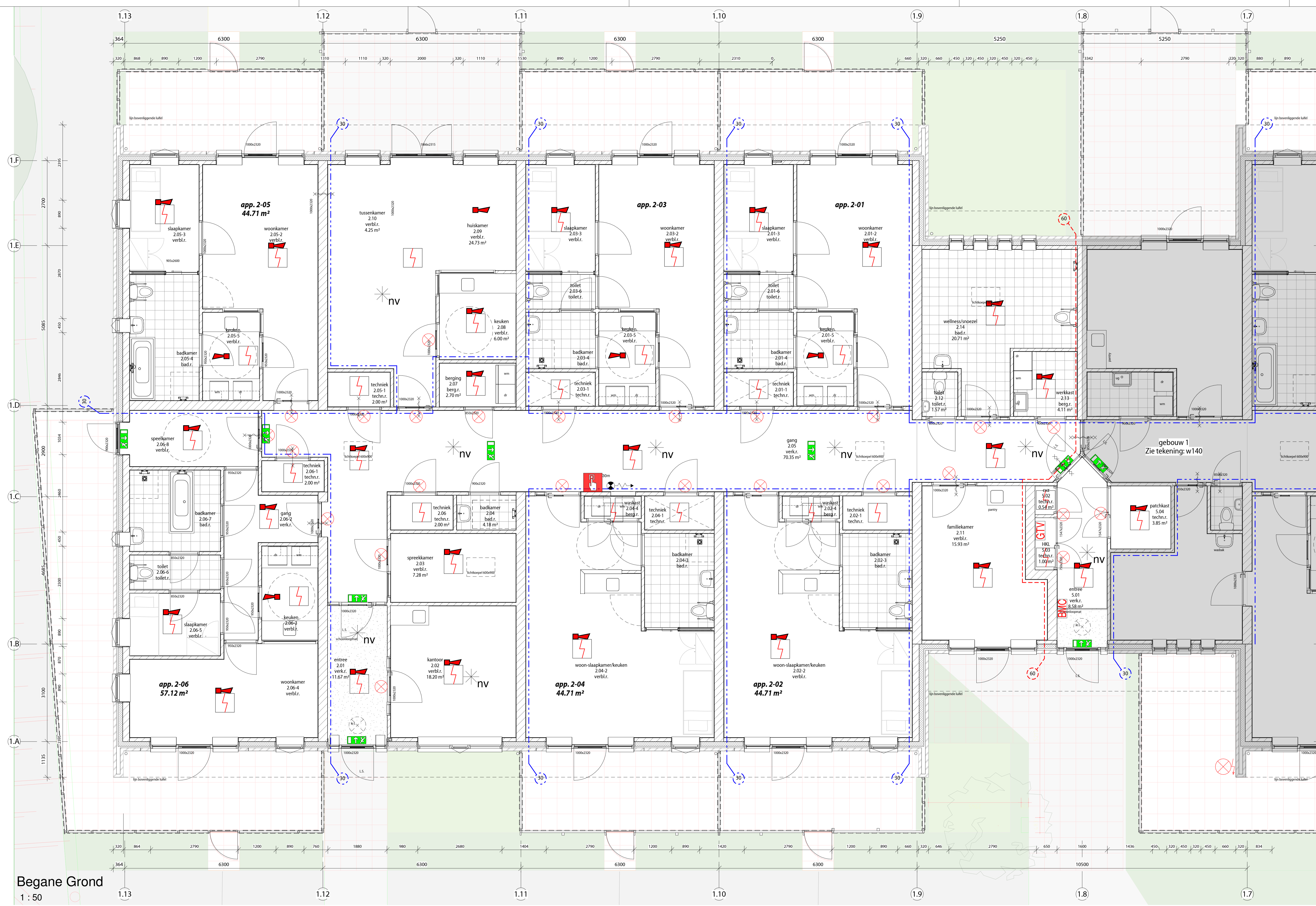
Begane Grond 1:50